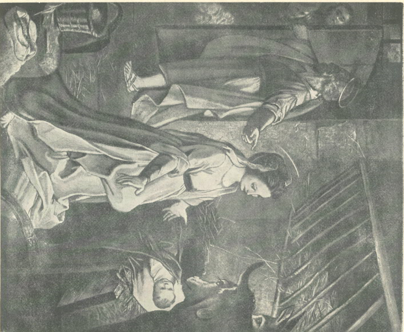
DE HEILIGE GEBORTE.

WEEKLIJKS NIEUWSBLAD VOOR HET PERSONEEL VAN DER HEEM N.V. DEN HAAG - HOLLAND - NEDERLAND. SCHE KROON RIJWELFABRIEK N.V.